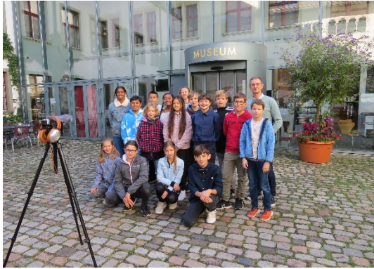
Die Primarschulklasse aus Hemmental bei den Dreharbeiten im Museum zu Allerheiligen Schaffhausen.