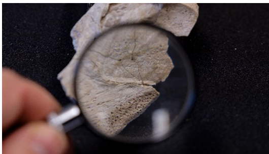
Angeknabbertes Nilferdohr oder Bruchstück eines Schildkrötenpanzers? Welche Geschichte verbirgt sich wohl hinter diesem Fossil aus dem Naturmuseum Solothurn?