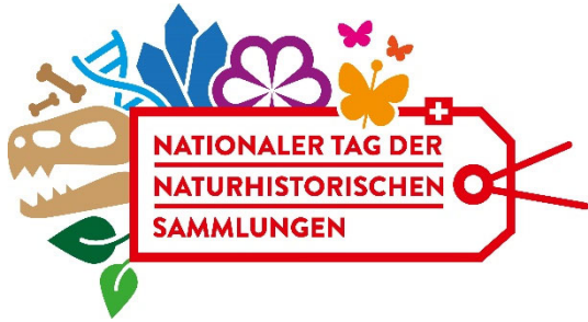
Logo Nationaler Tag der Naturhistorischen Sammlungen