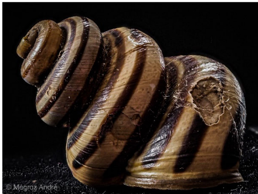
Aussergewöhnlich alte Schnecke oder ungeklärtes wissenschaftliches Mysterium? Womit erklärt sich die sonderbare Form dieses Objekts aus dem Naturmuseum St. Gallen?